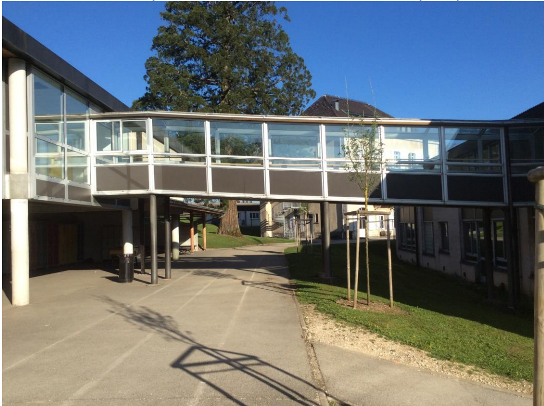
La fameuse passerelle reliant l'extension au bâtiment principal

Les anciens locaux sont aussi transformés, ainsi l'ancienne salle de techno devient un vaste CDI très lumineux.